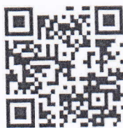
สิ่งที่ส่งมาด้วย ๒