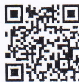
อ้างถึง ๒