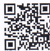
สิ่งที่ส่งมาด้วย